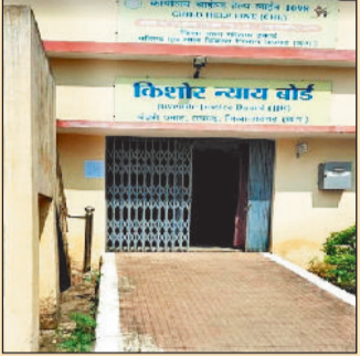
सभी प्रकरण किशोर न्याय बोर्ड में चल रहे हैं। इस आधुनिक और तकनीकी युग में नाबालिकों द्वारा भी मोबाइल सहित साशल मीडिया का उपयोग काफी ज्यादा किया जा रहा है। मोबाइल में विश्व के ज्ञान के साथ ही अपराधिक दुनिया में धकेलने

144 नाबालिक जघन्य अपराध में शामिल किशोर न्याय बोर्ड के आंकड़ों के अनुसार वर्ष 2025-26 में दर्ज किए गए प्रकरणों की संख्या बीते वर्षों की तुलना में सर्वाधिक 304 रही। जिसमें 48 गंभीर और 144 जघन्य अपराधों में संलिप्त रहे। जबकि 31 मार्च की स्थिति में 192 प्रकरण लिखित हैं। मुख्य बात यह है कि साल दर साल नाबालिकों का अपराध की दुनिया से नाता और गहरा होता जा रहा है, जो कि बड़ी चिंता का विषय है।