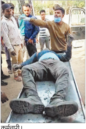
थोक में पहुंचे घायल श्रमिकों को शिफ्ट करते अस्पतालीन कर्मचारी।