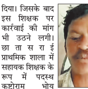
कड़ी कार्रवाई की मांग की। जब शिक्षक से पूछा गया तो उसने

बताया कि उसके घर में मेहमान आए थे, तभी उसने शराब पी और नशे की हालत में वह स्कूल पहुंच गया। इसी हालत में वह समिति के सदस्य व पालकों सक्रिय हुए और संकुल समन्वयक को लिखित शिकायत करते हुए शिक्षक पर कड़ी कार्रवाई की मांग की। जब शिक्षक से पूछा गया तो उसने