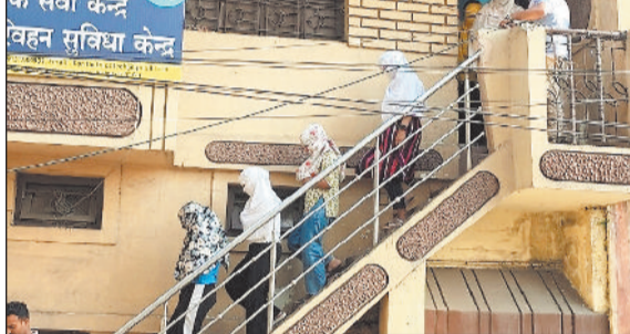
क सवा केंद्र परिवहन सुविधा केंद्र

सुंदर वधु दिलाने के नाम पर परिवहन सुविधा केंद्र एवं कम्प्यूटर संस्थान में चल रहे ठगी के कारोबार का भांडाफोड़ करने के साथ पुलिस की जांच दूसरी दिन भी जारी रही। इस दौरान पुलिस ने 55 मोबाइल, 13 लैपटॉप, 2 प्रिंटर सहित 3 बैंक खाते बरामद कर जब्त किया। जांच में 7 हजार 693 लोगों से कुल 1 करोड़ 11 लाख 36 हजार रूपय की ठगी करने की पुष्टि हुई है। मामले में संचालक समेत 26 युवतियों के खिलाफ कार्रवाई की जा रही है।