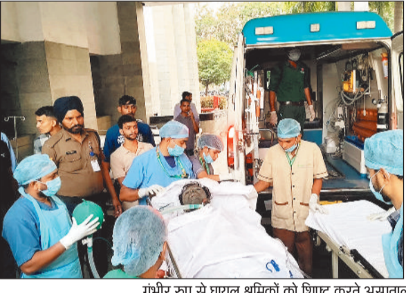
गंभीर रूप से घायल श्रमिकों को शिफ्ट करते अस्पतालीन कर्मचारी।